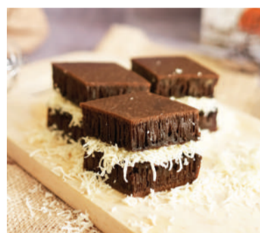
Chocolate +20 100% Premium Cocoa